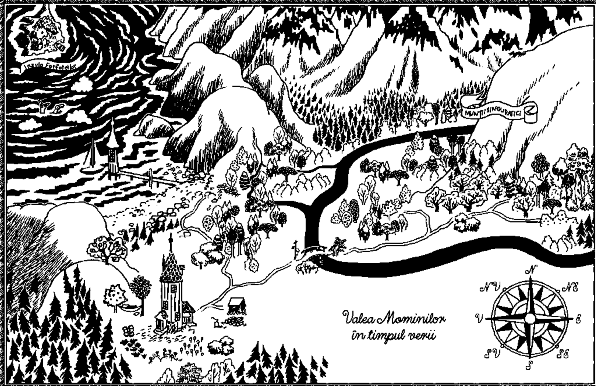
Valea Mominilor în timpul verii